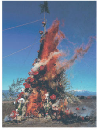
「どんど焼きの炎」 小坂 明(前橋市)