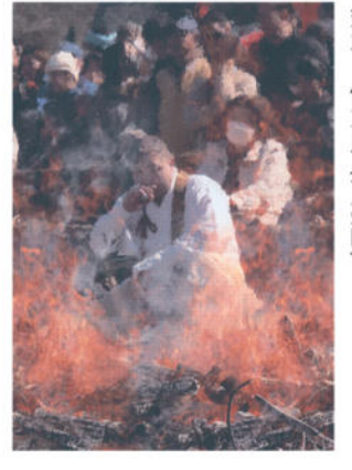
「炎と山伏」 鈴木 健太郎(甘楽町)

【講評】 合掌造り集落で知られる岐阜県の白川郷で撮影した夜景。ライトアップの光だるまか、雪原を照らす赤い光の模様を生かした不思議な情景に仕上げた。建物を2棟、前後にバランス良く並べ、遠近感も表現されている。格子の窓の明かりがアクセントになり、闇の中の建物が存在感を増した。夜の静寂が見事に表現されている。