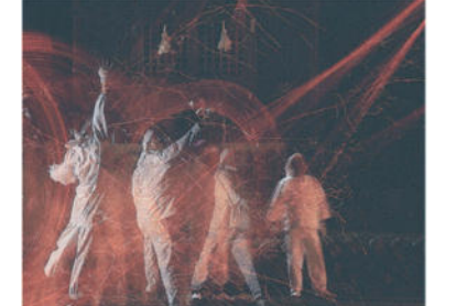
「飛んで回って御簀神事」