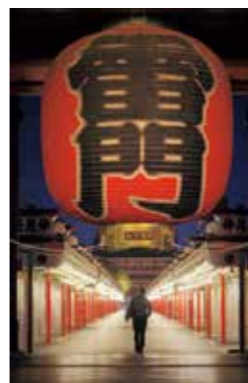
【第49回 上毛新聞社賞】 「早朝参拝」堀越 靖彦(藤岡)