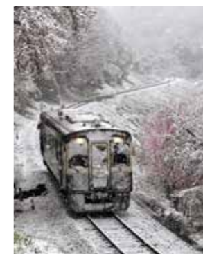
【第49回 上毛新聞社賞】 「わ鐵の顔」竹越 誠治(桐生)