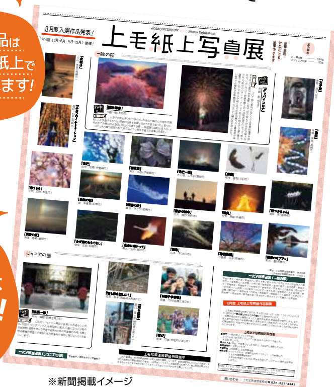
※新聞掲載イメージ