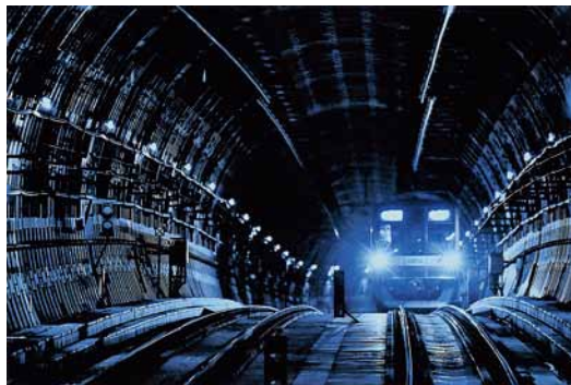
2019年紙上演真展年間賞 ジュニアの部・特選 「地下動脈」清水智裕