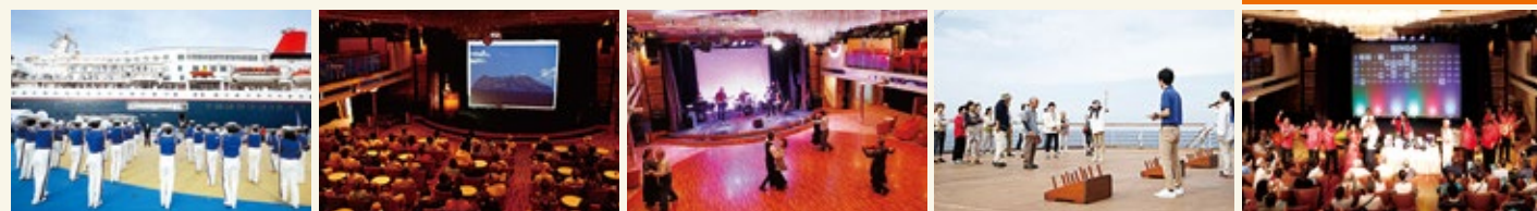
茨城県大洗港より出港 写真家 中村風詩人講座 ダンスタイム デッキゲーム 人気のピンゴゲーム