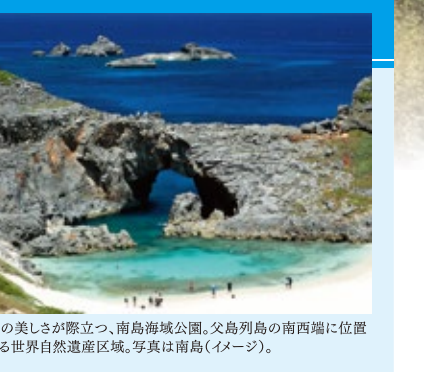
海の美しさが際立つ、南島海域公園。父島列島の南西端に位置する世界自然遺産区域。写真は南島(イメージ)。

東京の南、はるか1,000kmにある島々で、大小30余りの島からなる小笠原諸島は、誕生以来、一度も大陸とつながったことのない「海洋島」。ポニンプルーと呼ばれる小笠原特有の海の色も魅力のひとつ。島特有の動植物が多数存在し、2011年6月、世界でも希な固有の進化様式の場として高く評価され、世界自然遺産に登録されました。