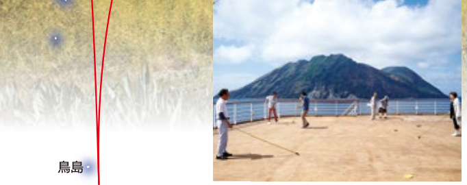
●鳥島 アホウドリの数少ない繁殖地で天然保護区域に指定されている無人島。