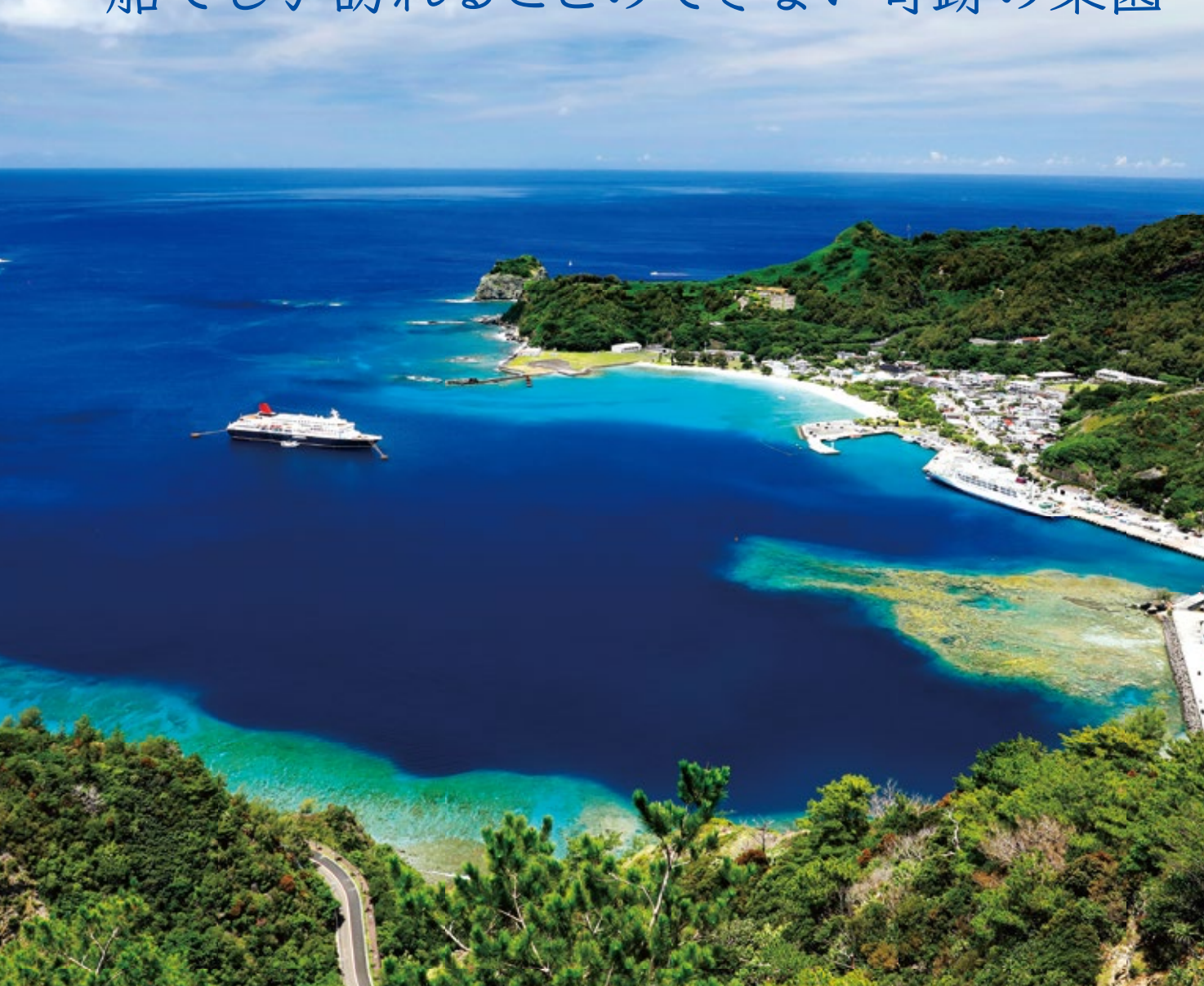
写真はすべてイメージです。