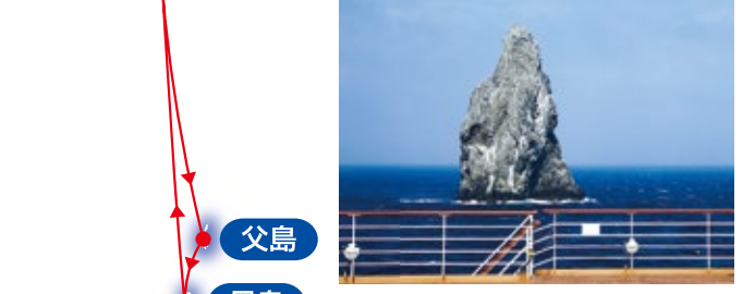
●姍婦岩 太平洋に突き出た高さ99mの不思議な岩です。