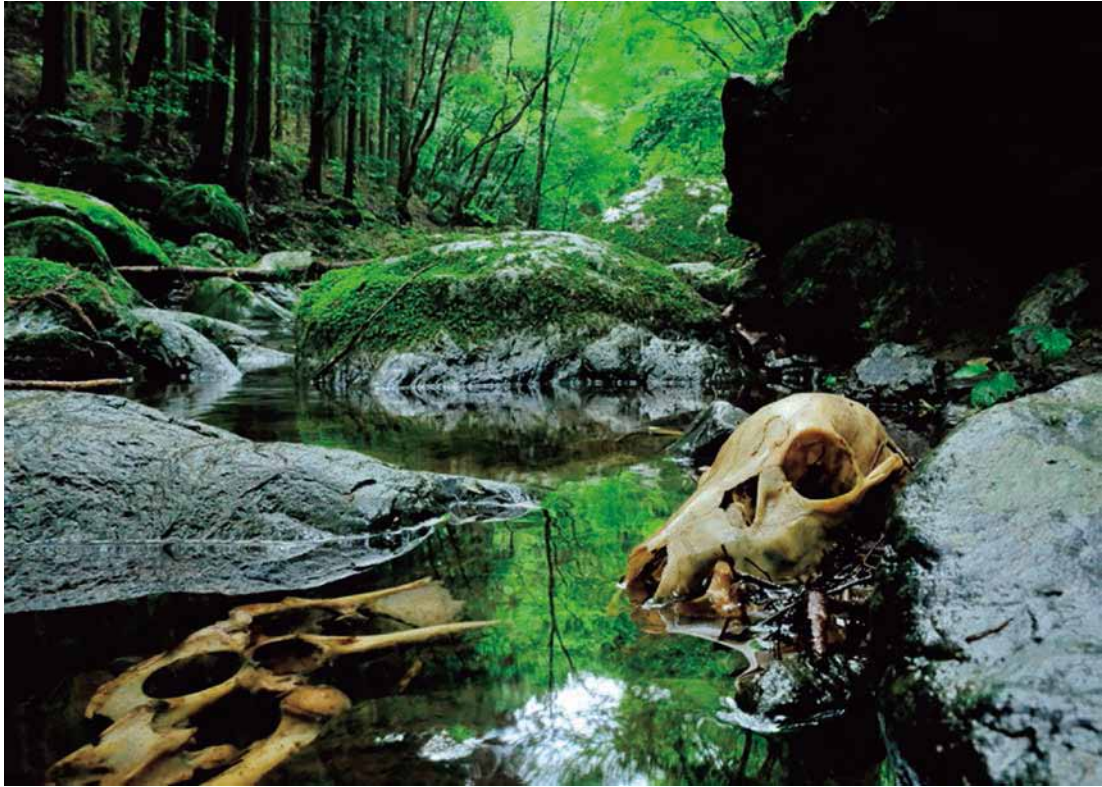
【第46回 上毛写真大賞】「輪廻」長谷川 秀夫(桐生)