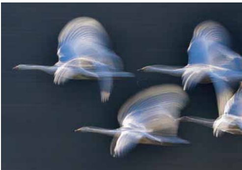
【第46回 上毛写真準大賞】「群翔」瀬山 光夫(館林)