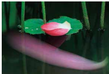
【第46回 上毛新聞社賞】「静風」安達 孝男(前橋)