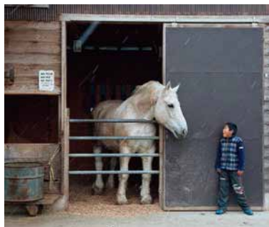
【第46回 上毛新聞社賞】「視線」反町 文子(高崎)