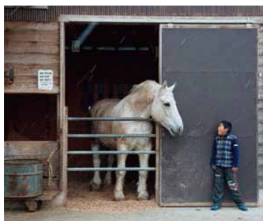
【第46回 上毛新聞社賞】「視線」反町 文子(高崎)