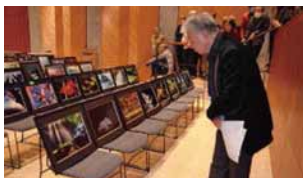
第46回 二次審査の様子