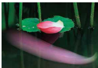
【第46回 上毛新聞社賞】「静風」安達 孝男(前橋)