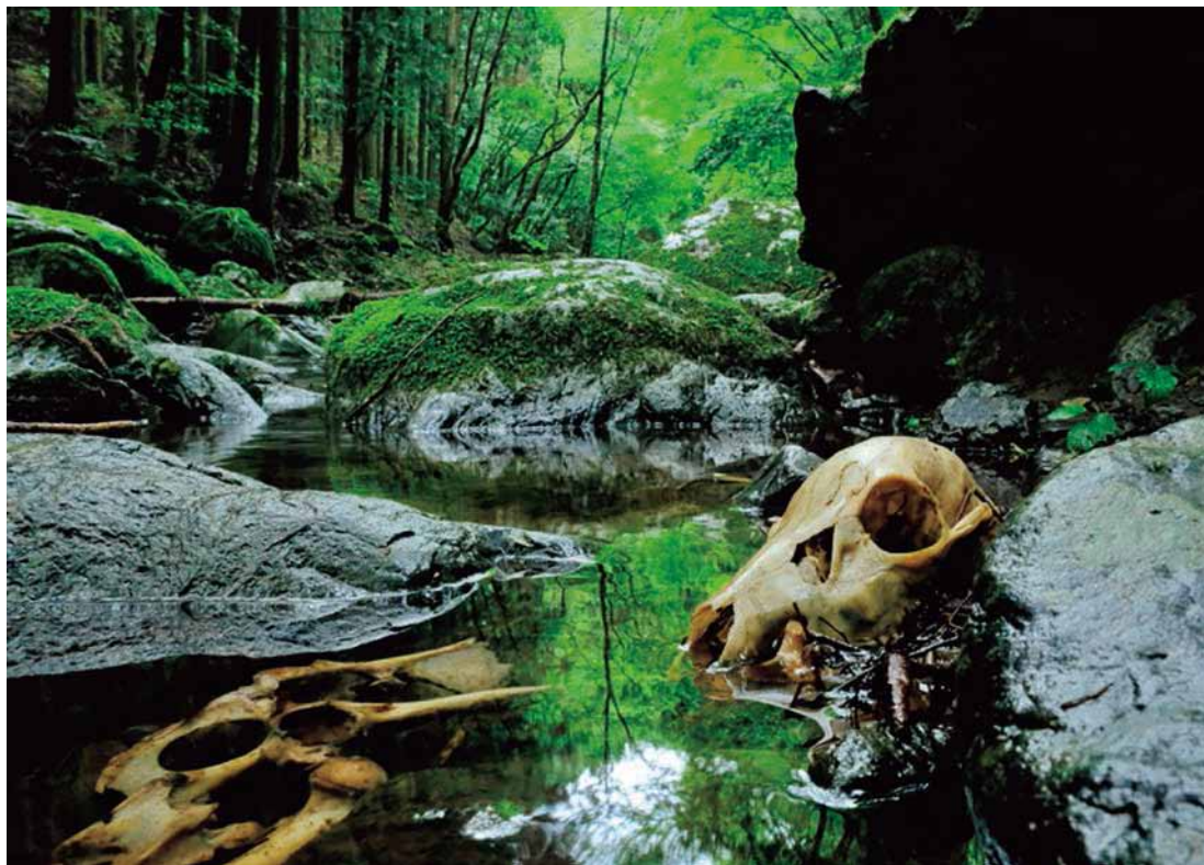
【第46回 上毛写真大賞】「輪廻」長谷川 秀夫(桐生)